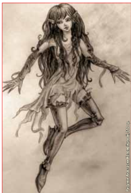
Рисунки Анастасии Колмогоровой, 512 пр.

Адрес редакции: 630039, г. Новосибирск, ул. Никитина, 155 тел.: 264-16-16