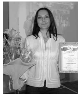
фотография, запечатлевшая всех участников конкурса.

Собрание, проходившее в творческой атмосфере, завершилось музыкальным приветствием, которое благодарные студенты посвятили своим кураторам. А напоминанием об этом событии будет групповая