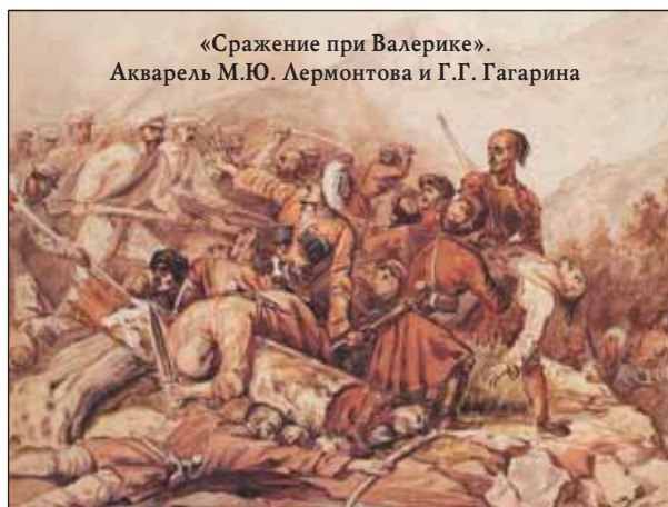
«Сражение при Валерике». Акваверс М.Ю. Лермонтова и Г.Г. Гагарина

Проза Лермонтова неповторима и замечательна. «Ге-