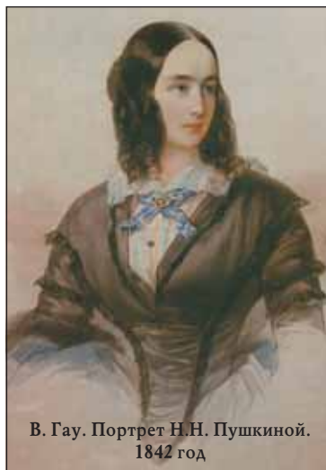
В. Гау. Портрет Н.Н. Пушкиной. 1842 год

Пушкин всю жизнь тренировался в стрельбе и действительно стрелял хорошо. Дантес был близорук, стрелял неважно. Пушкин доказал своё умение, когда смертельно раненый лёг на землю, прицелился – у него оставалось право второго выстрела. Дантес стоял, повернувшись к противнику правым боком, прикрывая его рукой с пистолетом согласно правилам. Пуля попала в кисть руки, в которой он держал пистолет, раздробила её. Оставшуюся жизнь Дантес доживал с искалеченной рукой.