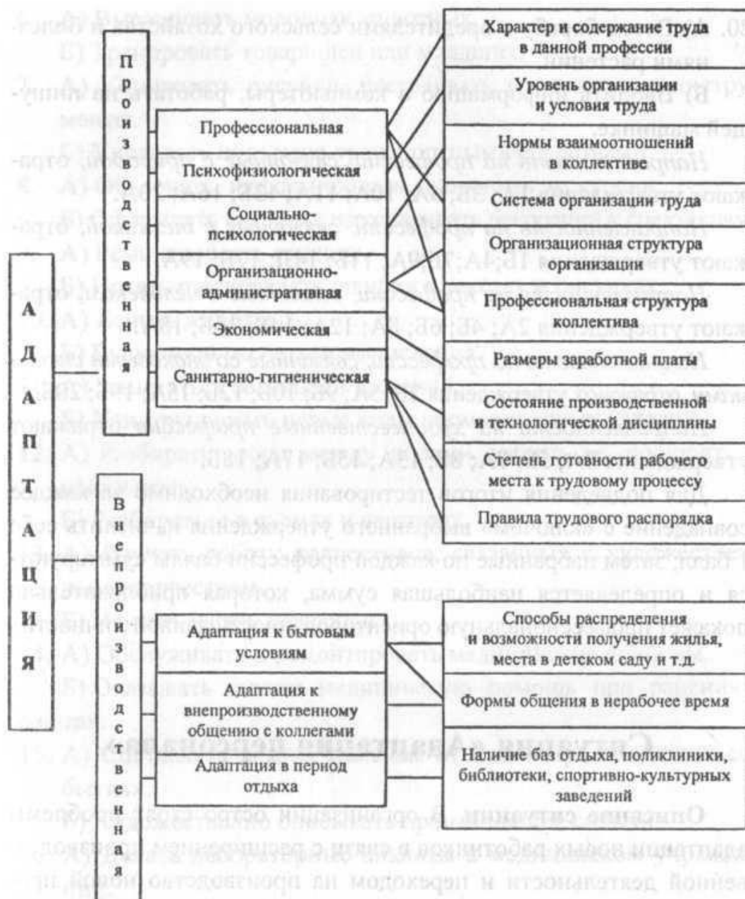
Рис. 1. Виды адаптации и факторы, на нее влияющие