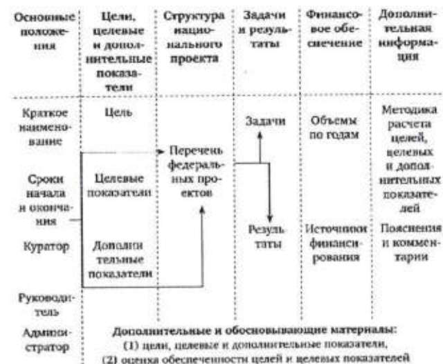
Рисунок – Структура паспорта национального проекта

национального проекта по предложенной схеме на рисунке, выбрав наиболее, по вашему мнению, важные цели и федеральные проекты (не менее 2х).