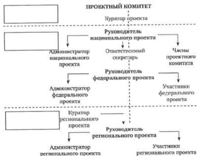
Рисунок – Архитектура организации проектной деятельности

Расположите системообразующие элементы архитектуры организации проектной деятельности (Региональный проектный офис, Ведомственный проектный офис, Проектный офис Правительства РФ) на рисунке.