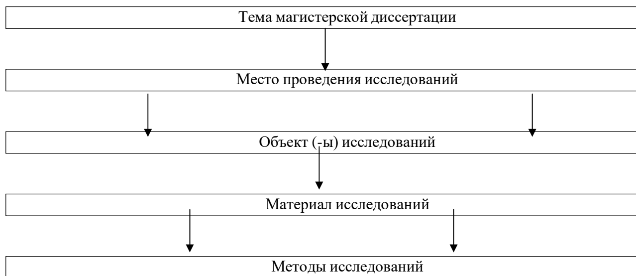
Рис. 1 Примерная схема исследований.

проектируемые или изучаемые показатели. Используемые методики включить в список литературы.