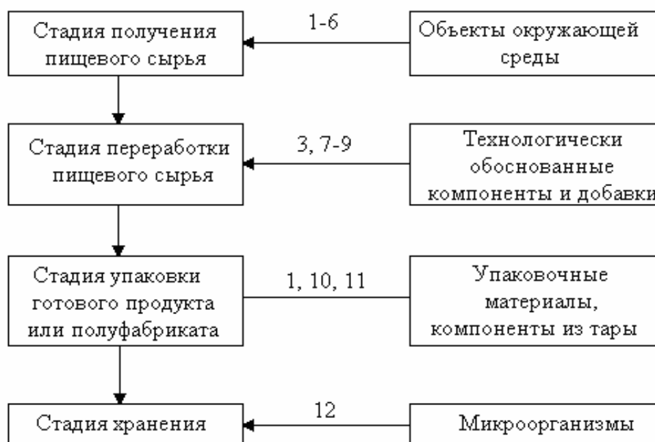
Рисунок 2 – Снижение экологической безопасности пищевой продукции на разных стадиях производства: 1 - тяжелые металлы; 2 - пестициды; 3 - нитраты; 4 - диоксины; 5 - вещества, используемые в ветеринарии; 6 - радионуклиды; 7 - нитриты, нитрозоамины; 8 - полиароматические УВ; 9 - пищевые добавки; 10 - мономеры; 11 - пластификаторы; 12 – микотоксины

Для производства животноводческого сырья не допускается применение кормовых добавок, лекарственных средств и препаратов, снижающих качество продуктов животного происхождения и не зарегистрированных в установленном порядке.