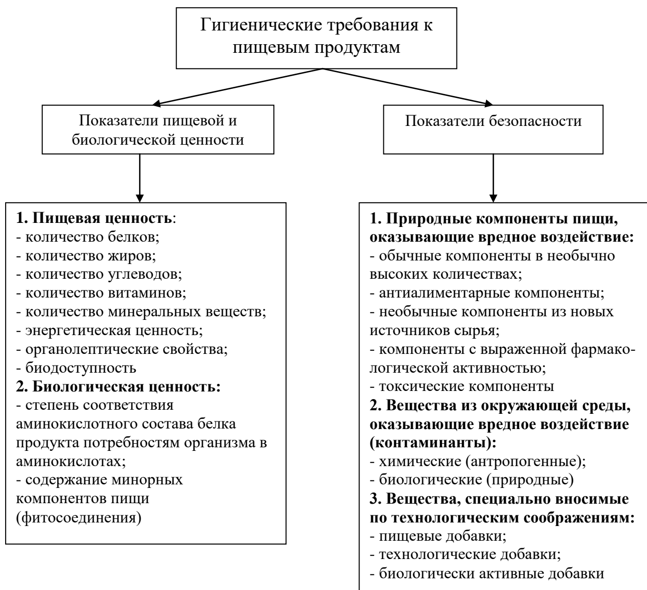
Рисунок 1 – Гигиенические требования к пищевым продуктам

Суть гигиенических требований, предъявляемых к пищевым продуктам (рисунок 1), сводится к их способности удовлетворять физиологические потребности человека в органолептических показателях, белках, жирах, углеводах, витаминах, минеральных элементах, энергии (пищевая ценность); незаменимых аминокислотах и минорных компонентах пищи (биологическая ценность); быть безопасными для здоровья человека по содержанию потенциально опасных химических, радиоактивных, биологических веществ и их соединений, микроорганизмов и других биологических организмов.