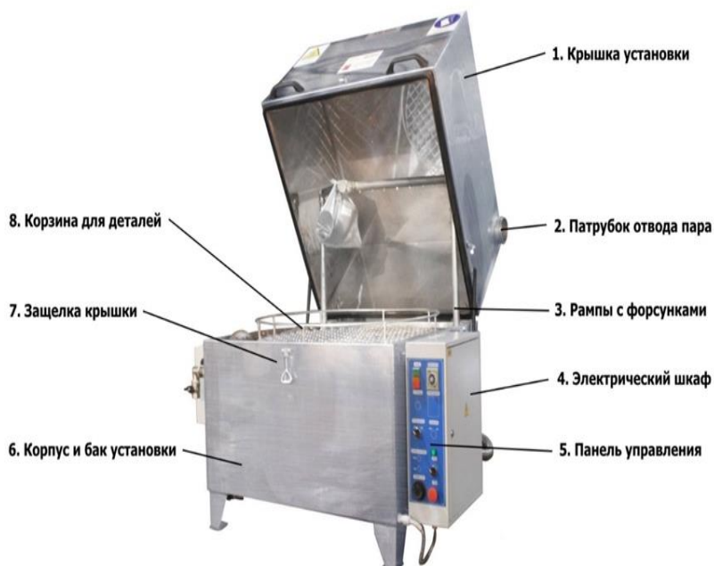
Рисунок 1 – Общий вид установки ТС-600

Моечная машина (далее установка) представляет собой струйную моечную камеру замкнутого цикла, предназначенную для очистки загрязненных маслом и жиром деталей машин, двигателей, промышленных станков и другого оборудования, путем воздействия моющего раствора под высоким давлением (до 3 бар) и температурой (до 90 °С). Установка пригодна для устранения других подобных загрязнений (мелкой стружки, СОЖ, пленок лакокрасочных покрытий, консервационных смазок, налета песка, пыли и т.п.).